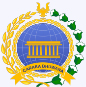
Kementrian Luar Negeri